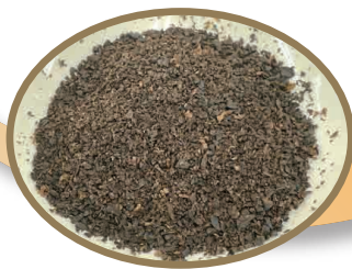
コーヒーグラウンズ

コーヒーグラウンズは、従来より様々な用途で再使用されてきています。肥料・堆肥、消臭剤・脱臭剤、防虫剤 など 。