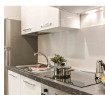
キッチン周り向け 塗料