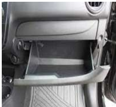
グローブボックス