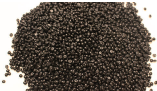
*リサイクル樹脂「INNOGREEN」写真：再生黒PP(自動車用途)