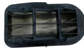
空気抜き(トランク)