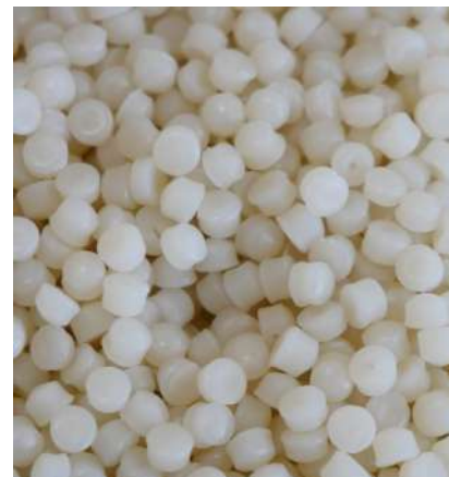
*リサイクル樹脂「INNOGREEN」写真：再生HDPE(透明グレード)