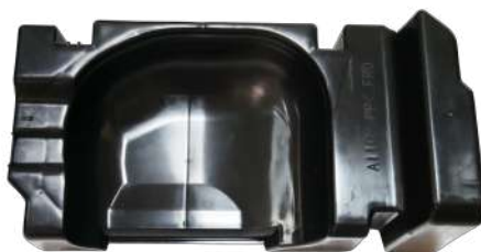
ドレンパン(冷蔵庫)